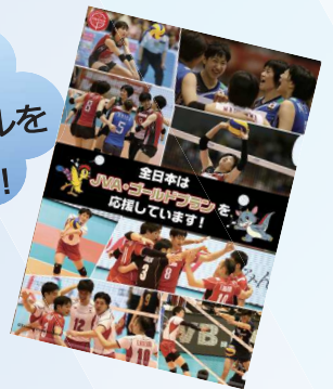
※写真は平成28年度のものになります。